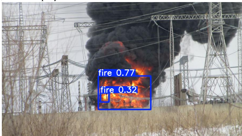
Рис. 1. Пример «проблемного» случая детекции объекта

В контексте подготовки данных для нейросетевых моделей в компьютерном зрении, активное обучение успешно применяется для задач семантической сегментации [11, 12], классификации медицинских изображений и детекции объектов в беспилотных системах. Например, в работе по обнаружению дефектов на производственных линиях этот метод позволил сократить объем ручной разметки на 40%, сохранив прирост точности. Подход в принципе остается единым: после начального обучения на небольшом размеченном датасете модель оценивает неразмеченные данные, выявляет среди них наиболее «проблемные» случаи, которые затем отправляются эксперту для разметки и добавляются в обучающую выборку. Цикл повторяется до достижения требуемых метрик качества, однако прямое применение классических подходов активного обучения к современным однопроходным детекторам, таким, как YOLOv8 [15], используемым в предлагаемой работе, сопряжено с техническими и методологическими сложностями. Пример «проблемного» случая детекции объекта представлен на рисунке 1.